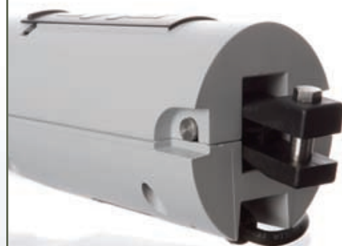
Fixation arrière légèrement orientable et pattes multi positions