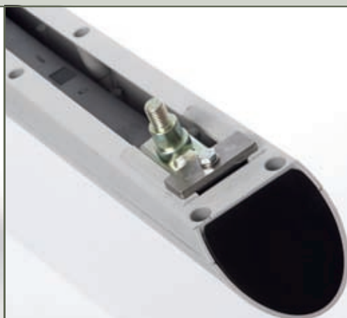
Vis Inox et butée mécanique réglable