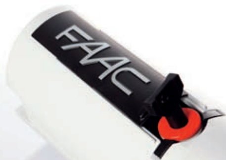
Déverrouillage manuel discret et efficace

Grâce à une conception moderne en 24 Volts, ce moteur et ses périphériques consomment très peu d'énergie. Le S418 peut ainsi bénéficier d'une alimentation par panneaux solaires.